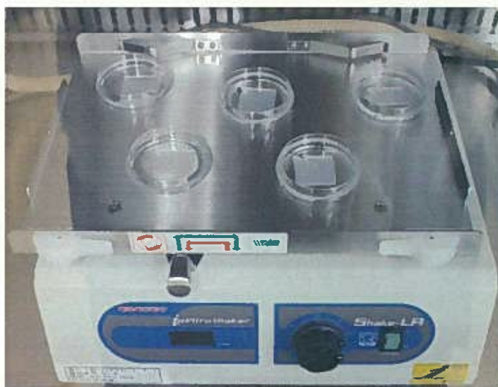
写真-1. 試験片作成状況

※2: 洗剤・石けん公正取引協議会が定める「住宅用合成洗剤及び石けんの除菌活性試験方法」の解説 1.5 試験試料, b) 試験試料接種量より、試験片用シャーレの面積から接種量を計算し、試験液をスプレーボトルに入れて用いる場合を想定したスプレー1回の相当量を 1 mL とした。