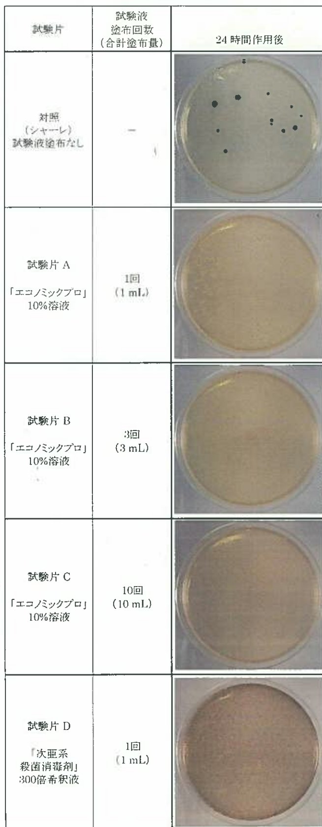
参考写真-3. 大腸菌に対する抗菌試験結果

[対照および試験片 D の青色コロニー: 試験菌, A~C のコロニー: エコノミックプロ含有菌]